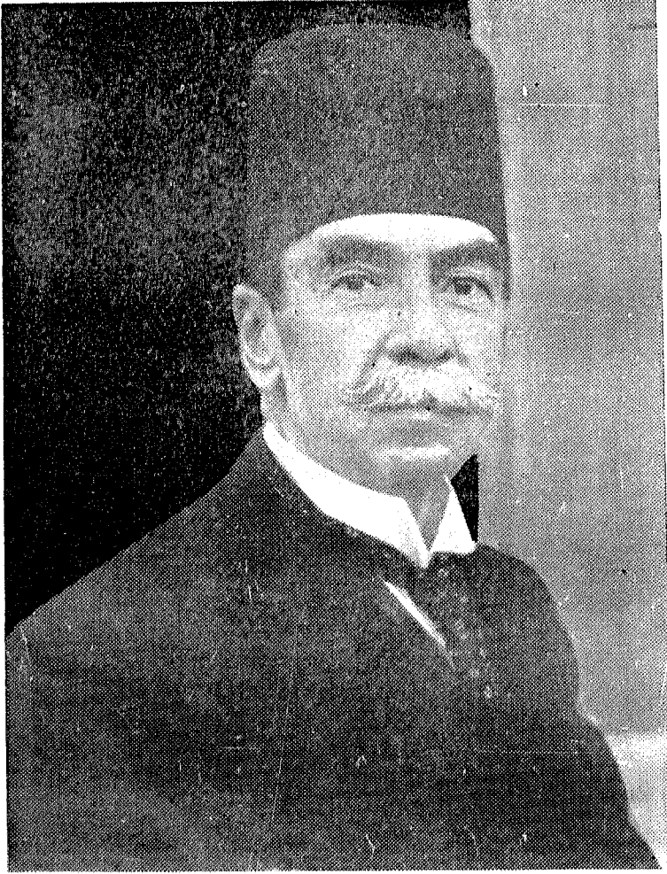
العلامة المحقق المغفور له احمد تيمور بابا شا